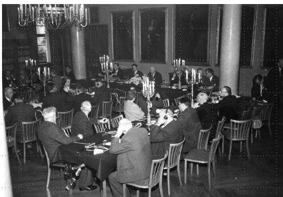
3. Europäischer Gemeindetag in Bad Homburg, 1956.