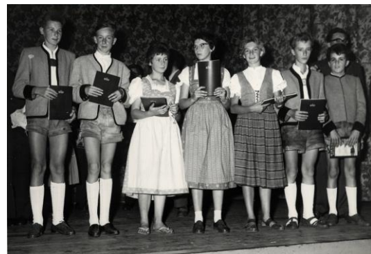
Jugendliche aus Mayrhofen in Bad Homburg, 1958.