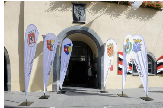
Geschmückter Eingang des Churer Rathauses, 23. September 2016.