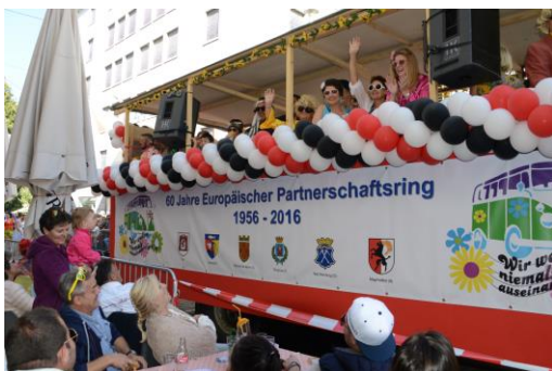
Hossa Mobil des Partnerschaftsring an der Schalgerparade, 24. September 2016.