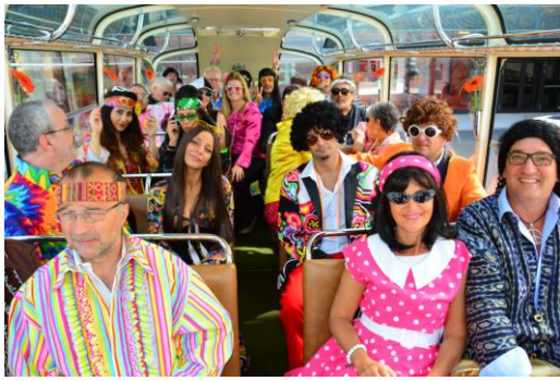
Verkleidete Vertreter der Partnerstädte an der Schlagerparade in Chur, 24. September 2016.