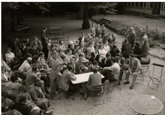
Internationales Jugendtreffen in Bad Homburg, 1958.

7.–16. August 1958: Internationales Jugendtreffen in Bad Homburg, an welchem Jugendliche aus den Partnerstädten teilnahmen.