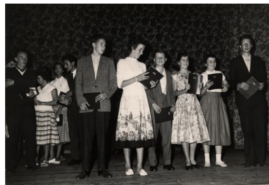
Churer Jugend in Bad Homburg, 1958.

7. November 1962: Austrittserklärung von Spa (Belgien).