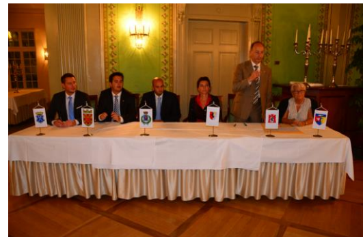
Vor der Unterzeichnung der Urkunde zum 60-Jahr-Jubiläum im Berner Restaurant „Zum Äusseren Stand“, 22. September 2016