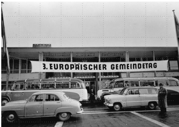
3. Europäischer Gemeindetag in Bad Homburg, 1956.

4.–7. Oktober 1956: 3. Europäischer Gemeindetag in Bad Homburg. Bei dieser Gelegenheit wurde die Urkunde zur Begründung des Partnerschaftsringes durch die Städte feierlich unterschrieben. Es schlossen sich Bad Homburg (Deutschland), Bougie/Bejaja (Frankreich/Algerien), Cabourg (Frankreich), Chur (Schweiz), Mayrhofen (Österreich), Mondorf-les-Bains (Luxemburg), Spa (Belgien) und Terracina (Italien) zusammen. Die Unterzeichnung fand im Beisein von Walter Hallstein statt, dem Staatssekretär des deutschen Auswärtigen Amtes. Die Anwesenheit dieses führenden Europapolitikers belegt die hohe Bedeutung, die der Gründung des Partnerschaftsringes beigemessen wurde.