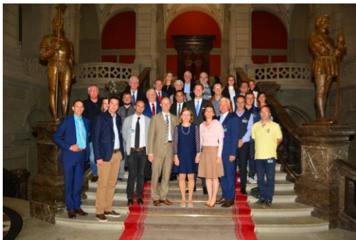
Gruppenfoto der eingeladenen Vertreter der Partnerstädte mit der amtierenden Nationalratspräsidentin Christa Markwalder im Bundeshaus in Bern, 22. September 2016.