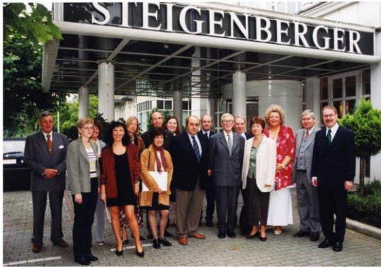
Die Teilnehmer des Partnerschaftstreffens vor dem Steigenberger Hotel in Bad Homburg, 2000.

9. August 2006: Treffen in Mondorf-les-Bains anlässlich des 50-Jahr-Jubiläums des Partnerschaftsringes.